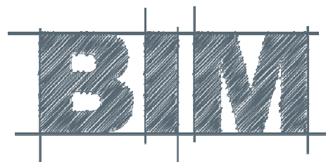
Près de 120 personnes présentes !